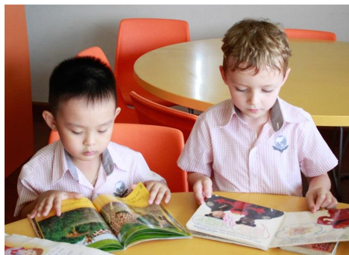
Lớp Prep trong giờ luyện đọc

Địa chỉ: Trường Quốc Tế Singapore tại Đà Nẵng Tòa nhà SIS, Vùng Trung 3, Khu đô thị mới Phú Mỹ An, Phường Hòa Hải, Quận Ngũ Hành Sơn, TP. Đà Nẵng SĐT: +84 511 384 0495 – Fax: +84511 3981 044 Email: enquiry@danang.sis.edu.vn