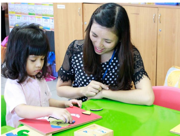
Hoạt động của lớp K2