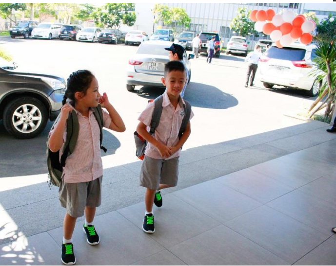
Chào mừng các em quay trở lại năm học mới tại trường Quốc tế Singapore

Tôi đã cảm nhận được sự chào đón nồng nhiệt từ phía giáo viên và học sinh giành cho tôi. Và tôi tin rằng tất cả những giáo viên mới khác cũng có cùng cảm nhận như vậy. Các em học sinh trông rất tuyệt và lịch sự trong bộ đồng phục của trường. Các thầy cô giáo đã củng cố lại những nội quy nhà trường và tổ chức buổi sinh hoạt toàn trường đầu tiên thành công với sự tham gia tích cực của toàn thể học sinh. Hiện tại, chúng tôi đang hướng dẫn các em phải bỏ rác đúng nơi quy định sau khi ăn và đi bên phải khi đi lên xuống cầu thang và hành lang. Điều này giúp bảo đảm an toàn cho mọi người khi số lượng học sinh hiện nay ngày càng tăng.