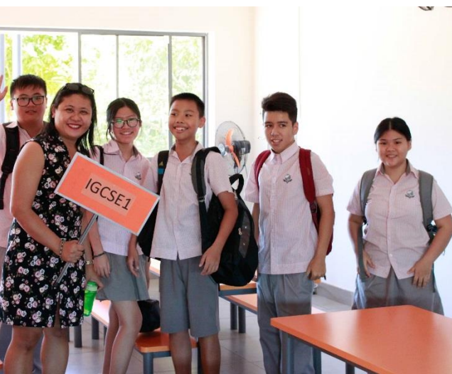
Học sinh lớp IGCSE 1 năm học 2016 - 2017

Chào đón phụ huynh và các em đến với năm học 2016 – 2017. Thật là một niềm hân hạnh khi được đảm nhiệm vị trí Hiệu trưởng tại trường chúng ta. Với 10 năm kinh nghiệm trên cương vị Hiệu trưởng trường trung học ở Úc, tôi rất vui được đến Việt Nam để bắt đầu công việc tại một hệ thống trường khác. Tôi vừa hoàn thành xong chương trình Thạc sĩ chuyên ngành Giáo dục các trường Quốc tế tại Đại học New England và hy vọng rằng sẽ ứng dụng những gì đã nghiên cứu vào thực tiễn.