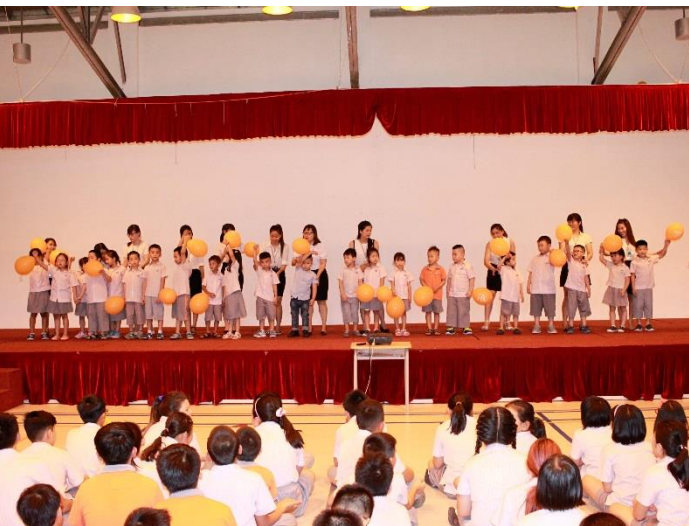
Buổi sinh hoạt toàn trường đầu tiên năm học 2016 - 2017

Trong không khí vui tươi đón chào năm học mới 2016 -2017, ngoài việc chào đón những học sinh cũ trở lại lớp học sau kì nghỉ hè, nhà trường còn rất hân hạnh đón nhận 23 học sinh mới vào lớp 1 và 35 học sinh mới (từ lớp 2 đến lớp 9) của các trường trên địa bàn TP Đà Nẵng, Hội An , Hà Nội,... chuyển về. Xin cảm ơn quý vị phụ huynh và các em học sinh đã đặt niềm tin vào nhà trường.