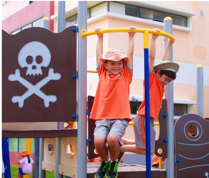
Những công dân năng động và khỏe mạnh trong giờ ra chơi

Tất cả các em học sinh lớp 7, IGCSE và lớp 2 đã có những tiết mục văn nghệ rất hay và đặc sắc trong buổi sinh hoạt đặc biệt dành cho học sinh lớp 1 đến lớp 9. Xin chúc mừng cô Laurel và các em học sinh!