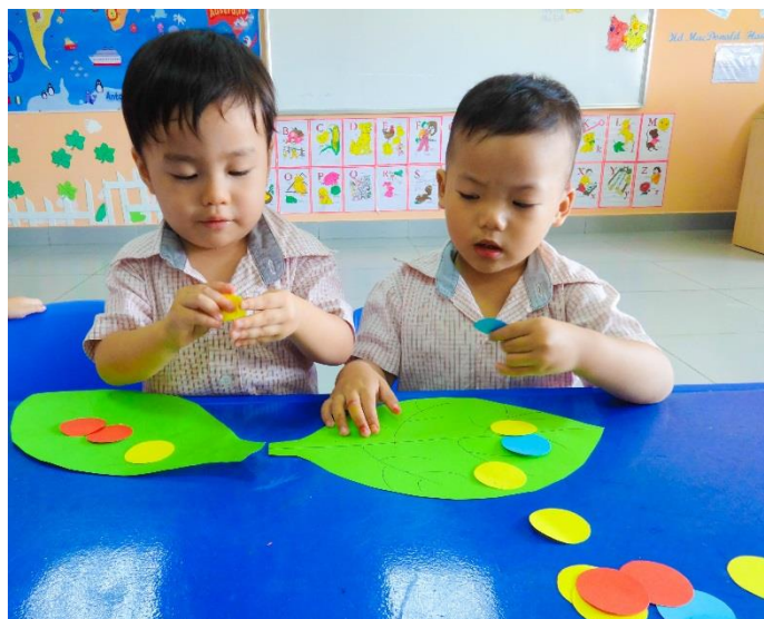
Các em nhỏ lớp Nursery học về màu sắc