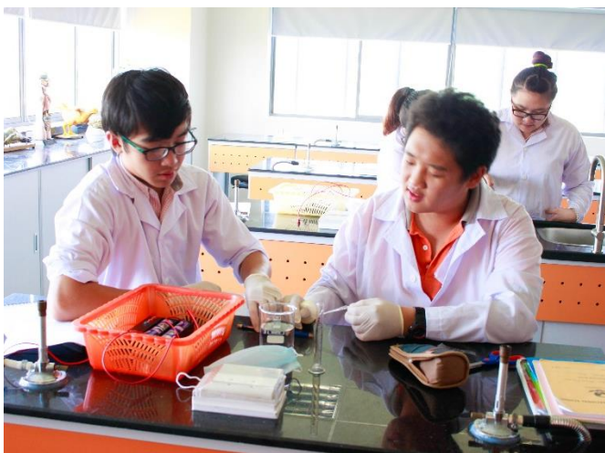
Lớp IGCSE 2 - Học sinh có kỹ năng tư duy cao