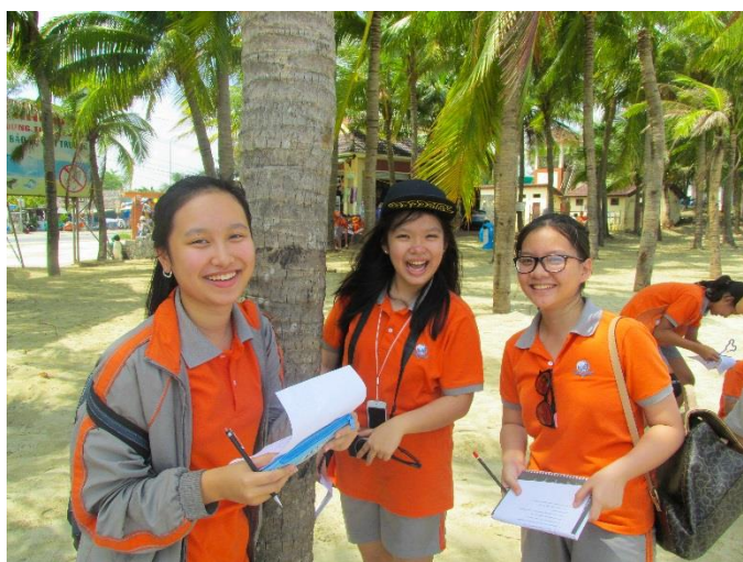
Chuyến dã ngoại môn nghiên cứu xã hội và nhặt rác góp phần làm sạch bãi biển

Địa chỉ: Trường Quốc Tế Singapore tại Đà Nẵng Tòa nhà SIS, Vùng Trung 3, Khu đô thị mới Phú Mỹ An, Phường Hòa Hải, Quận Ngũ Hành Sơn. TP. Đà Nẵng SĐT: +84 511 384 0495 – Fax: +84511 3981 044 Email: enquiry@danang.sis.edu.vn