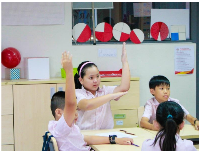
Lớp 5 Song Ngữ - Học sinh có thành tích học tập tốt