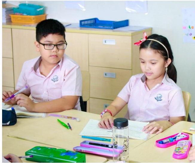
Các bạn lớp 1 song ngữ đang rèn luyện để trở thành những Học Sinh Tự Tin Trong Giao Tiếp