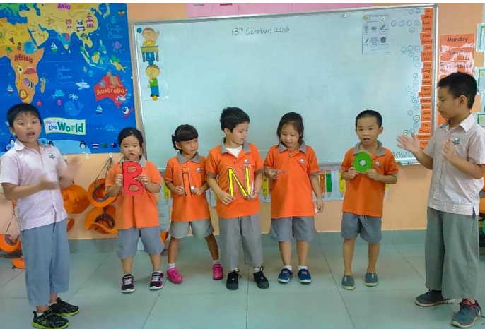
Những học sinh tự tin trong giao tiếp lớp 3 /4 Quốc tế