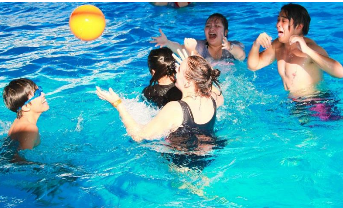
Giờ học bơi của lớp IGCSE 2