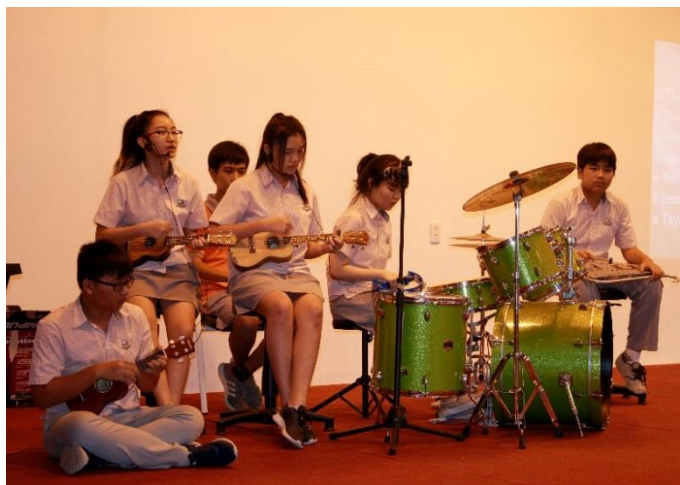
Buổi biểu diễn văn nghệ của lớp IGCSE 1