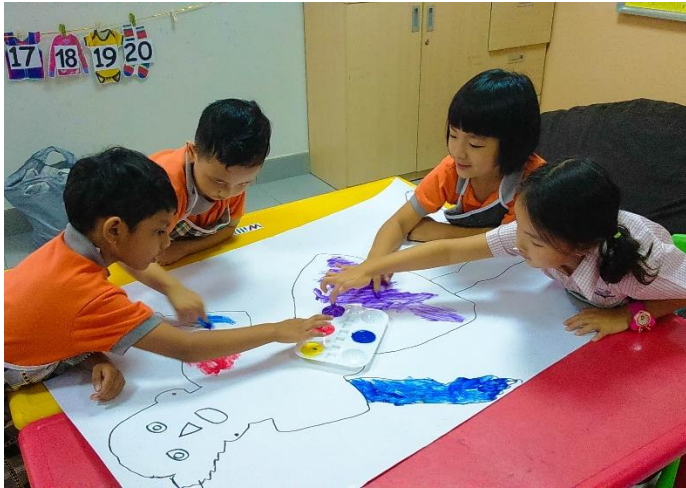
Giờ Mỹ thuật của các em nhỏ K2A